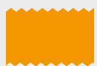
เฟล็กซิเบิล

※โปรดติดต่อเราเกี่ยวกับวาล์ว, แฟรงก์ และอื่นๆ