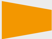
รีดิวเซอร์