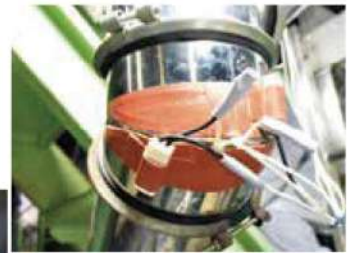
Loại khuấy tay