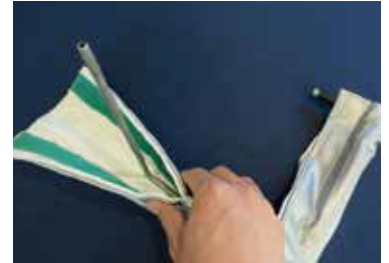
ท่อท่อตัว L แบบยึดหยุ่นได้อย่างง่ายดาย