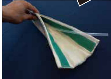
ติด/ถอดออกได้ง่าย