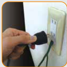
เสียบปลั๊กบนเต้ารับ (100V)