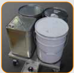
วางถังกลมขนาดเล็กหรือถัง 18 ลิตรบนฮีตเตอร์ (สูงสุด 4 ถัง)

ตั้งตัวควบคุมอุณหภูมิที่อยู่ด้านข้างของตัวทำความร้อนออก