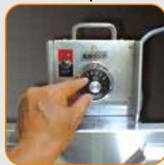
หมุนเป็นหมุนเพื่อปรับอุณหภูมิ (สูงถึง 110 °C)