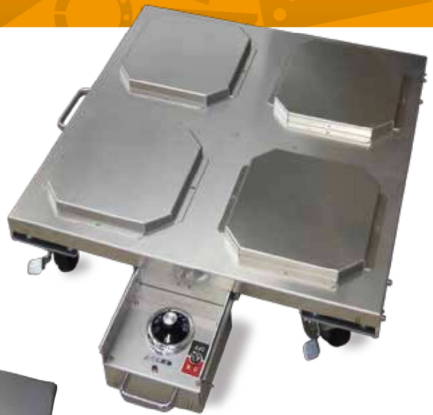
※Vỏ cách nhiệt được bán riêng.