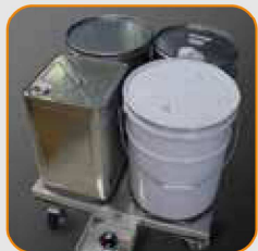
Đặt lon thùng hoặc lon 5 gallon vào lò sưởi (Tối đa bốn lon)