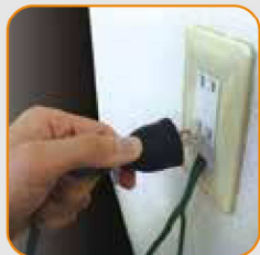
Cắm phích cắm vào ổ cắm. (100V)