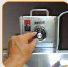
Xoay nút xoay để điều chỉnh nhiệt độ. (Lên đến 110 °C)